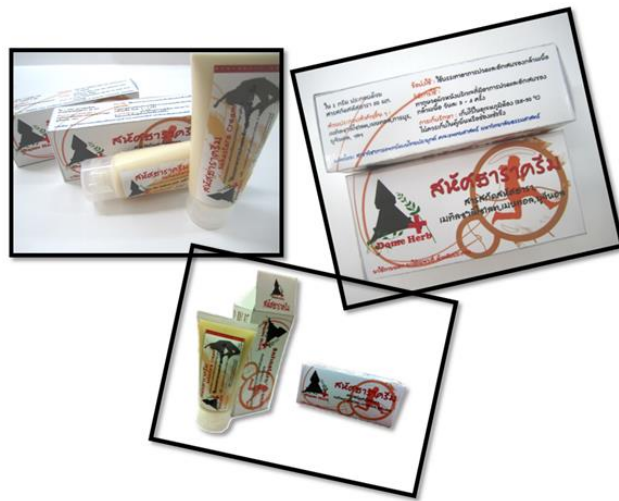
ครีมสหัสธารา