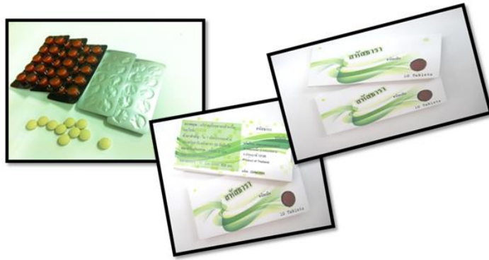
ยาเม็ดสหัสธารา